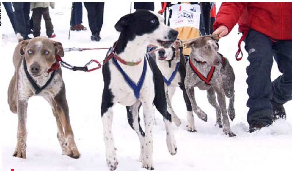
JAKUSZYCE, 7–10 STYCZNIA. Nie tylko rasowe psy mogą ciągnąć sanie wyścigowe

Przez trzy dni na trasach biegowych na Polanie Jakuszyckiej, zamiast tradycyjnych narciarzy, królowały psy zaprzęgi. Wszystko w ramach kolejnej edycji cyklu wyścigów psich zaprzęgów Husqvarna Tour. Była to już czwarta odsłona tych zawodów. Według organizatorów, jest to najtrudniejszy międzynarodowy średniodystansowy wyścig psich zaprzęgów. Na starcie stanęły 42 załogi – tzw. marszerzy i 436 psów – z całej Europy. Trasa wyścigu liczyła w tym roku prawie 300 km. W zeszłorocznej edycji, która odbyła się w Karpaczu, wzięło udział około 200 psów i 20 właścicieli, którzy pobiegli na dystansie około 200 km. Wśród zwierząt można było podziwiać takie piękne rasy, jak: alaskan malamute, pies grenlandzki, samojed i husky syberyjski oraz psy nierasowe.