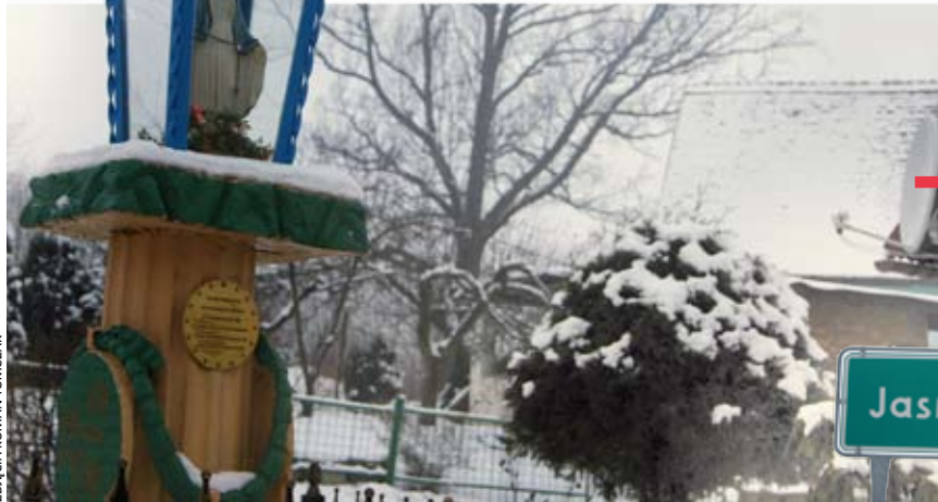
Jasna Góra. Przydomowa kapliczka maryjna