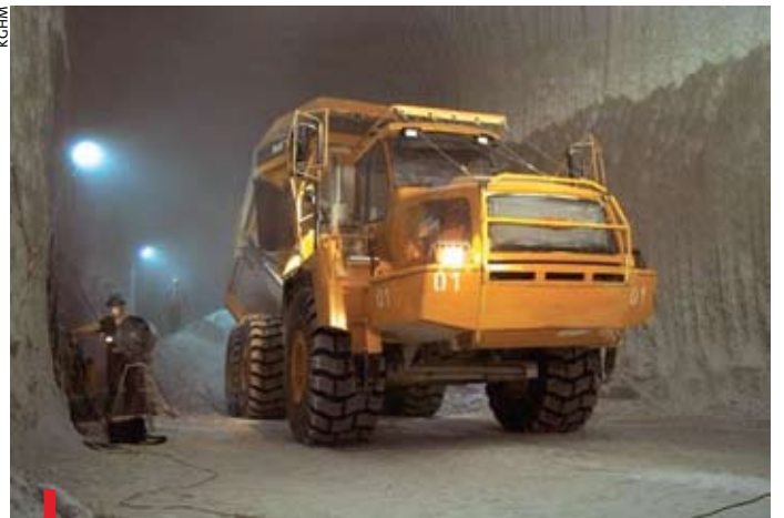
Miedziowy holding jest gwarantem stabilności gospodarczej naszego regionu

ZAGŁĘBIE MIEDZIOWE. Skarb Państwa wystawił na sprzedaż 10 proc. swoich akcji w miedziowym holdingu (w sumie jest właścicielem 41,79 proc. ogółu udziałów). Resort liczy, że na sprzedaży 20 mln akcji zarobi na Giełdzie Papierów Wartościowych 2 mld zł. Rząd kontynuuje prywatyzację KGHM, mimo sprzeciwu związków zawodowych i samorządów z Zagłębia Miedziowego. Te obawiają się od początku całkowitej prywatyzacji spółki. Rysowany przez protestujących scenariusz obejmuje stopniowe wycofywanie się prywatnej