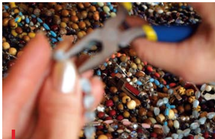
W zeszłym roku organizatorzy zbierali porwane różańce, a w tym roku czekają na połamane świece

Ta specjalna świeca symbolizuje Zmartwychwstałego Chrystusa, a płomień ognia przywodzi na myśl żywą obecność Ducha Świętego – Miłości, która będzie tematem przewodnim Legnickiego Marszu pod hasłem: „Niesiemy światło”.