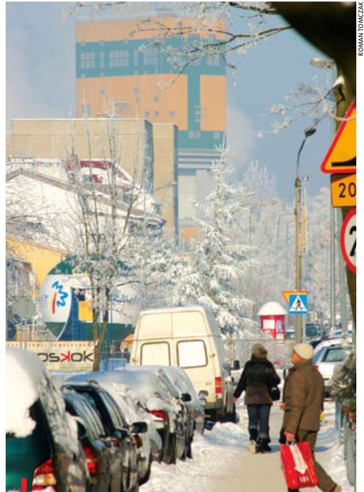
Podatki od kopalni miedzi za eksploatację górniczą sięgają nawet 60 proc. rocznego dochodu gmin górniczych