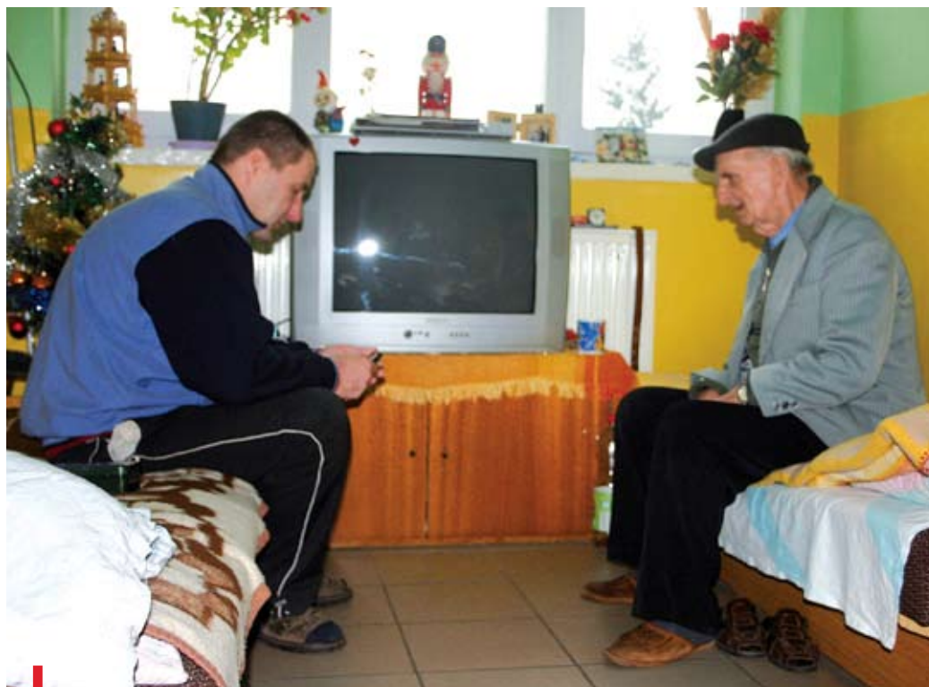
Na zdjęciu zgorzeleckie schronisko dla bezdomnych. Co roku zajęte są tu wszystkie łóżka. Jednak nie wszyscy bezdomni chcą zimować w schroniskach