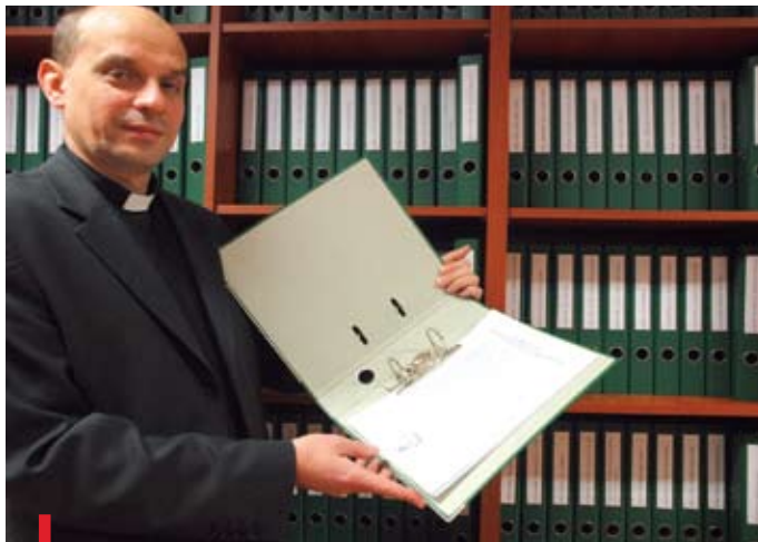
W sekretariacie synodu regały są pełne protokołów z prac poszczególnych zespołów parafialnych