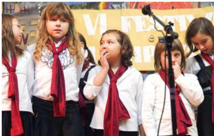
Salezjański przegląd jest jednym z wielu spotkań kołędowych w naszej diecezji w okresie bożonarodzeniowym