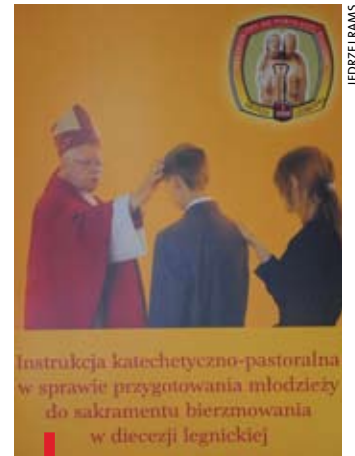
Instrukcja katechetyczno-pastoralna w sprawie przygotowania młodzieży do sakramentu bierzmowania w diecezji legnickiej