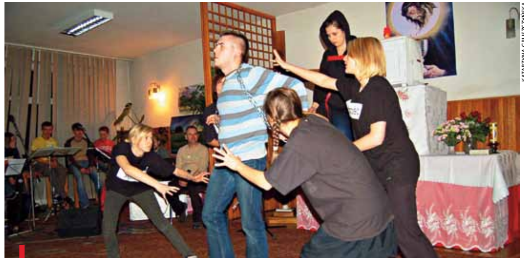
Pantomima to jeden z najbardziej sugestywnych środków przekazu ewangelizacyjnego. Na zdjęciu uczestnicy tegorocznych rekolekcji w Rakowicach

Ewangelizowanie ochrzczonych przez działanie Ducha Świętego – to podstawowe zadanie