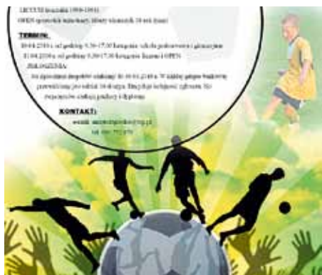
AUTOR: PKS „EMAUUS” ZAGRODNO