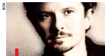
Jacek Wójcicki

BOGATYNIA. Wielkimi krokami zbliża się święto „poezji tego świata”. Poezji, która koi i wzrusza. Poezji pełnej wdzięku i gracji. Poezji, którą jest... kobieta. Z tej właśnie okazji w sobotę 6 marca o godz. 17 w sali widowiskowej Bogatyńskiego Ośrodka Kultury odbędzie się recital Jacka Wójcickiego – aktora, śpiewaka, jednego z członków krakowskiej „Piwnicy pod Baranami”. Wójcicki ukończył Wydział Aktorski w Państwowej Wyższej Szkole Teatralnej w Krakowie. Wielokrotnie doceniany i nagradzany, m.in. nagrodą na Przeglądzie Piosenki Aktorskiej we Wrocławiu (1986) i Krajowym Festiwalu Polskiej