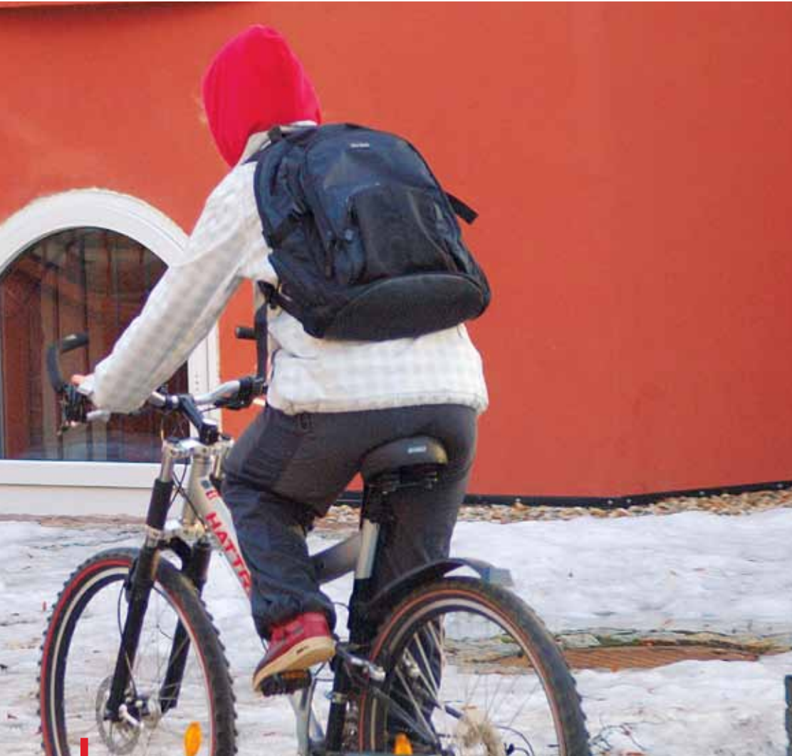
Okno Życia jest już montowane, więc jest nadzieja, że ruszy w ustalonym terminie

zaniedbania. – No, chyba że w czasie badania w szpitalu okaże się, iż dziecko było wcześniej bite albo dopuszczono się na nim karygodnego zaniedbania. Ale są to raczej skrajne przypadki. Dlatego, jeżeli kobieta będzie chciała odebrać dziecko, my ze swojej strony gwarantujemy jej bezpieczeństwo – dodaje. – Podobnie, jak w przypadku, gdy podejmie decyzję o pozostawieniu dziecka w szpitalu.