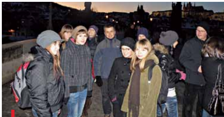
Praga będzie wspomniana jako piękne miejsce spotkania z ciekawymi ludźmi