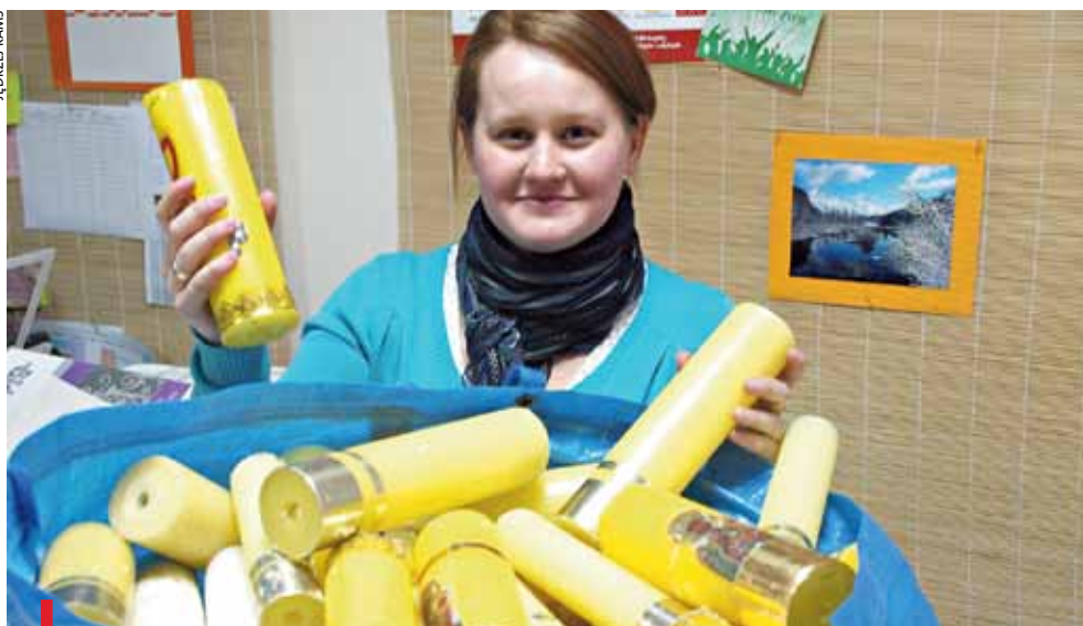
LEGNICA. Zebrane świece czekają na wysłanie do fabryki, skąd wrócą jako paschały, symbole zwycięskiego Chrystusa

Do biura Katolickiego Stowarzyszenia Młodzieży trafiły pierwsze kartony z połamanymi i wypalonymi świecami. Jest to efekt pozytywnej odpowiedzi niektórych parafii na inicjatywę organizatorów I Legnickiego Marszu Dla Życia. Zebrane stare świece zostaną przetopione na nowe, piękne paschały. Zostaną one rozdane po Marszu dla Życia w Niedzielę Palmową 28 marca. W zeszłym roku zbierano zniszczone różańce, które rozdawano osobom modlącym się za nienarodzone dzieci. W tym roku organizatorzy chcą łączyć całe wspólnoty parafialne w modlitwie za nienarodzonymi. Zapalony paschał ma towarzyszyć im w czasie spotkań modlitewnych. Dlatego parafie zbierają i dostarczają świece. Jedną z nich jest parafia pw. św. Mikołaja w Chmielenu.