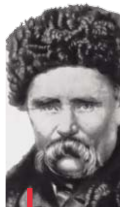
Taras Szewczenko. Dla jednych był przyjacielem Mickiewicza, dla innych – polonofobem

Innym zaślepnieniem pod adresem niektórych organizacji kresowych jest sprawa zwrócenia się do