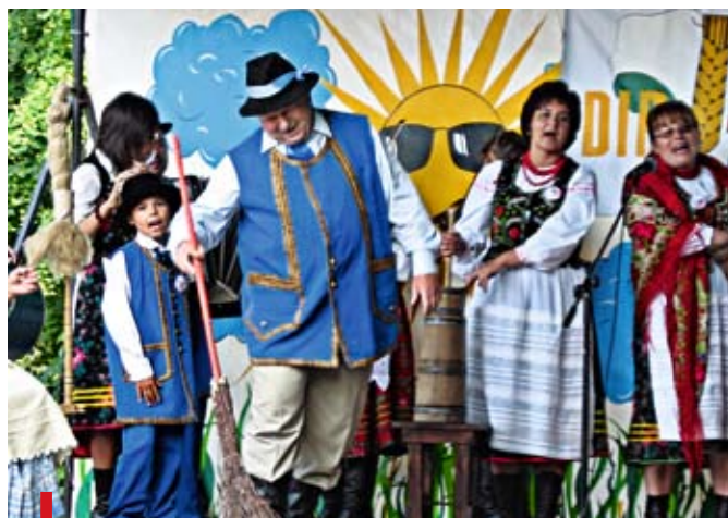
Gdzie się nie pojawiają, zbierają nagrody. „Podolanki” pielęgnują tradycję i kulturę przyniesioną tutaj z Kresów