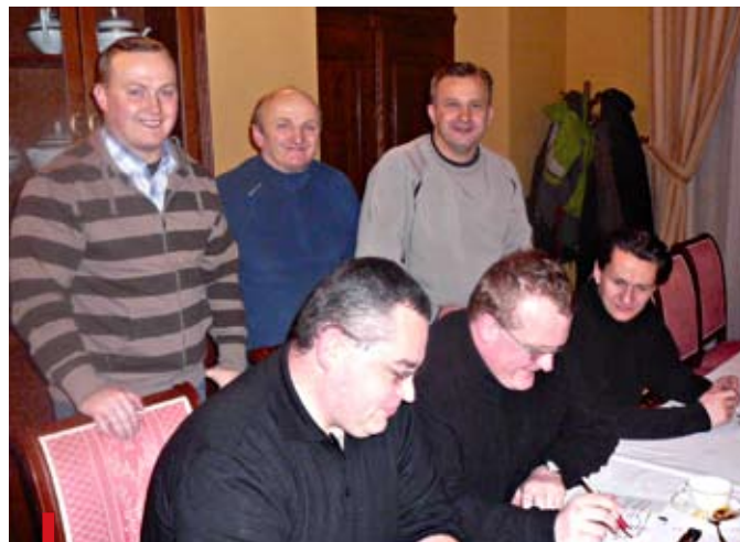
Organizatorzy XVII Pieszej Pielgrzymki z Legnicy na Jasną Górę podczas spotkania w Krzeszowie

Księża przewodnicy ustalili, że następne spotkanie odbędzie się we wtorek 5 maja w legnickiej