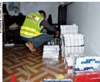
Wszystkie przejęte przez celników nielegalne papierosy wędrują do pieca

znaleźli nielegalne papierosy i alkohol. Łącznie pogranicznicy zabezpieczyli ponad 700 paczek papierosów z ukraińskimi i rosyjskimi znakami akcyzy skarbowej oraz 19 litrów alkoholu. Wartość kontrabandy to ponad 6,5 tys. zł. W Przesieczanach zgorzeleccy strażnicy graniczni zatrzymali obywatela Boliwii, który nielegalnie przebywał na terytorium naszego kraju – nie posiadał wymaganych przepisami prawa dokumentów. Na mocy postanowienia Sądu Rejonowego w Zgorzelcu mężczyźnie umieszczono w Ośrodku dla Cudzoziemców w Krośnie Odrzańskim gdzie będzie czekał na wydalenie z Polski.