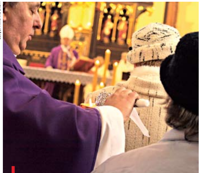
Wierni włączają się w duchową adopcję w wielu parafiach naszej diecezji