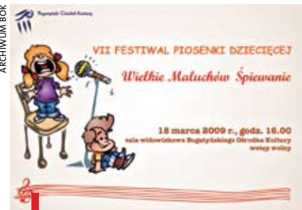
Plakat promujący VII FPD

BOGATYNIA. VII Festiwal Piosenki Dziecięcej „Wielkie Maluchów Śpiewanie” odbył się 18 marca w Bogatyńskim Ośrodku Kultury. Własne prezentacje wokalne przedstawiły przedszkolaki z całego miasta i gminy. Festiwal miał charakter przeglądu, dlatego też dzieci i ich występy nie były poddawane ocenie jurorów, ale każda prezentacja została nagrodzona drobnym upominkiem i okolicznościowym dyplomem.